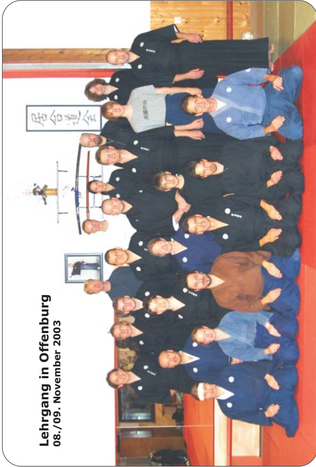
Lehrgang in Offenburg 08./09. November 2003