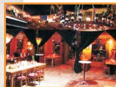
... »Casa Verde«