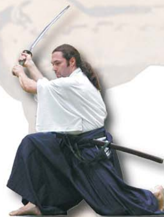
Fehr-Sensei 7. Dan

皆様オッフエンブルグによようこそ。 先生を居合道会の道場にを迎えて きて光栄です。先生にご指導戴く 事を大変うれしく思います。 ようこそいらっしやいました。