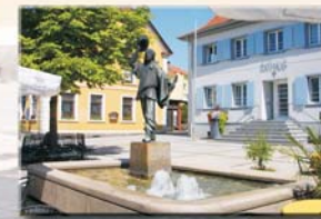
Jäger von Soest-Denkmal ゾーストの狩人の記念碑