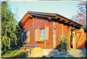
Rebhüsl-Hütte レープヒースル・ヒュッテ

Für den Ausklang des Abends mit unseren japanischen Gästen haben wir uns ebenso eine kleine Besonderheit ausgedacht. Im Anschluss an den Lehrgang wollen wir im »Rebhüsl« in Mösbach zum Abendessen einkehren. Das Rebhüsl ist eine Holzhütte, die mitten in den Weinbergen oberhalb Mösbachs steht. Von hier aus hat man einen wunderschönen Ausblick über die Rheinebene bis hinüber ins Elsass. Bei offenem Kaminfeuer werden wir badisches Essen und den Wein aus dem Anbaugebiet der uns umgebenden Rebberge genießen können. Die Teilnahme am gemeinsamen Abendessen kostet 18,00 € pro Person . Hierin sind die anteilige Hütten-Miete, das Essen, Apfelsaft, Mineralwasser und der Edelbrand nach dem Essen enthalten. Eine Voranmeldung ist unbedingt erforderlich (siehe Anmeldeschluss).