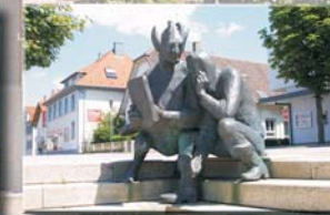
Grimmelshausen und Fabeltier グリメルスハウゼンと寓話の動物