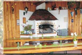
Rebhüsl-Kamin レープヒースルの暖炉