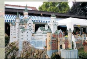
Schloss Neuschwanstein ノイ・シュバンシュタイン城

Für ein großes Ausflugsprogramm ist die Zeit leider zu knapp bemessen. Dennoch bietet ein kleiner Ausflug in die nähere Umgebung die Möglichkeit gleich vier deutsche Schlösserlandschaften zu erkunden und zu bestaunen. So planen wir am Nachmittag mit den Sensei einen Besuch im Schlosscafé in Achern-Mösbach . Im dortigen Miniatur-Schlossgarten befinden sich maßstabsgetreue Nachbauten der Schlösser Neuschwanstein, Linderhof, Lichtenstein und der Burg Hohenzollern . Selbstverständlich darf hier auch ein Stück der berühmten original Schwarzwälder Kirschtorte nicht fehlen.