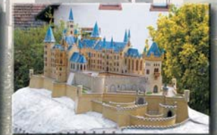
Burg Hohenzollern ホーエジツォレルン城