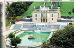
Schloss Linderhof リンダーホーフ城