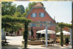
Grimmelshausen-Museum グリメルスハウゼン・博物館