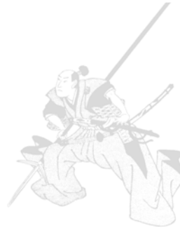
無近勝利 © 2011