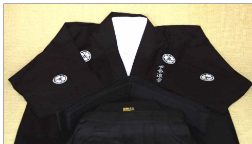
»iaidogi« mit Eishin-Ryū-Mon (Wappen), Hadagi, Obi und Hakama

Zur traditionellen Bekleidung im Iaido gehören eine Jacke (»iaidogi«), eine Unterziehjacke (»hadagi«), ein etwa 8 cm breiter und 4 m langer Gürtel (»obi«) zur Schwertaufnahme und ein weiter Hosenrock (»hakama«). Die klassischen Farben des Iaido sind dunkelblau oder schwarz. Im Iaido gilt das traditionelle Graduierungssystem vom Schüler- (Kyū) zum Meistergrad (Dan). Es gibt jedoch keine Gürtelfarben, die die Graduierung anzeigen.