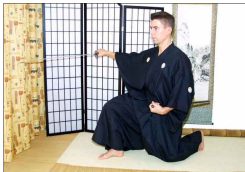
Die Zieh- und Schneid- bewegung »Nukitsuke«

Iaido setzt sich aus den drei japanischen Schriftzeichen »I(ru)« (sein), »ai« (zusammentreffen) und »dō« (Weg) zusammen. Es bedeutet soviel wie »ganz dasein«. Die Einheit von Geist (ki), Schwert (ken) und Körper (tai) zu jedem Zeitpunkt des Iai-Trainings. Das Schriftzeichen »dō« symbolisiert hierbei den klassischen »Weg« bei der Erlernung der Kampfkünste - ein ständiges »sich-verbessern-wollen«. Technisch gesehen steht im Iaido das Beherrschen des Samurai-Schwertes in sich ändernden Körperhaltungen mit verschiedenen Zieh- und Schnitttechniken im Vordergrund. Der Iaidoka trainiert hierbei die überlieferten Waffenübungen, die von den Samurai ebenso ohne Partner geübt wurden. Im Iaido versucht man den imaginären Gegner schon vor dessen erster Aktion durch die eigene innere Haltung zu beherrschen. Sein Angriff soll jedoch blitzschnell abgewehrt werden und in der überlegenen Reaktion mit dem eigenen Schwert wird die Auseinandersetzung beendet.